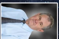
Micsocz Páma ipapais