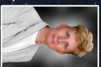
Caemman-we Pukler Silla