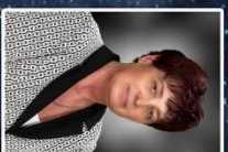
Velcomé Szabé Rissa ipapais kelpetis