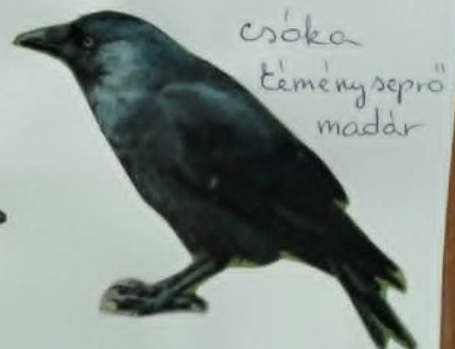
csóka "keményseprő" madár