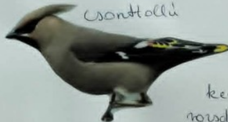
kerti roszda- farkú