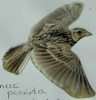
mezei pacsirta szépen énekel