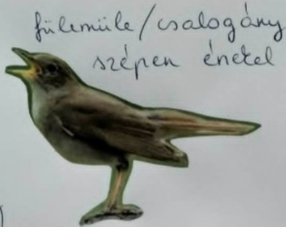
fülemüle / csalogány szépen énekel